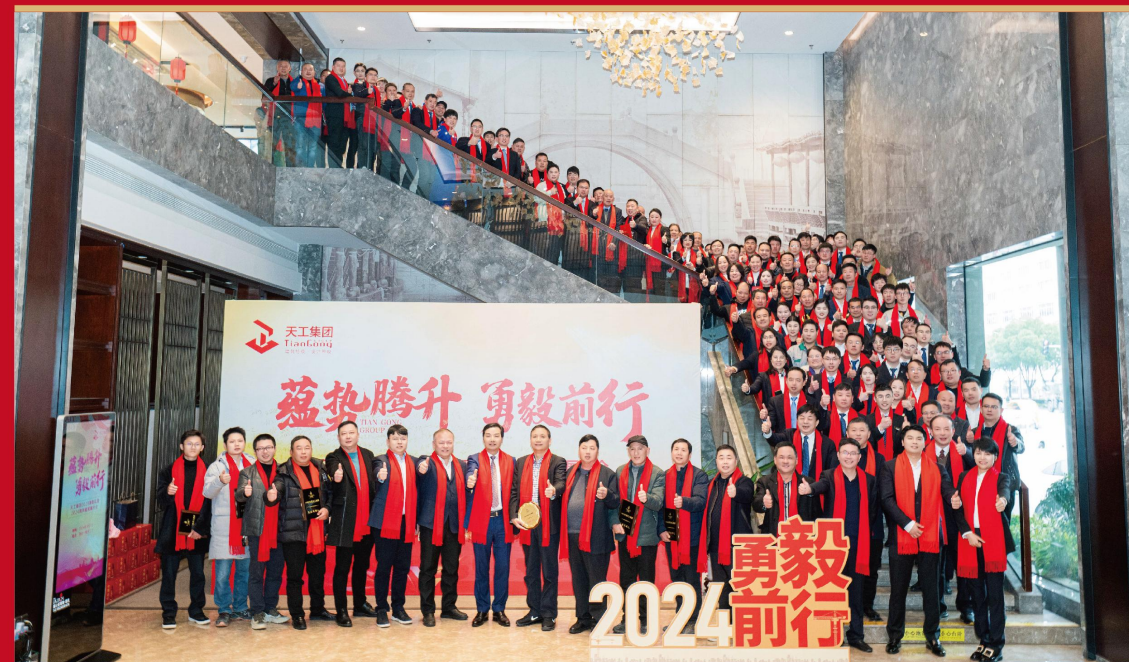
天工集团2023表彰礼暨2024高质量发展大会圆满举行